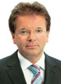
Rudi Anschöber, Landesrat für Umwelt, Energie, Wasser und KonsumentInnenchutz